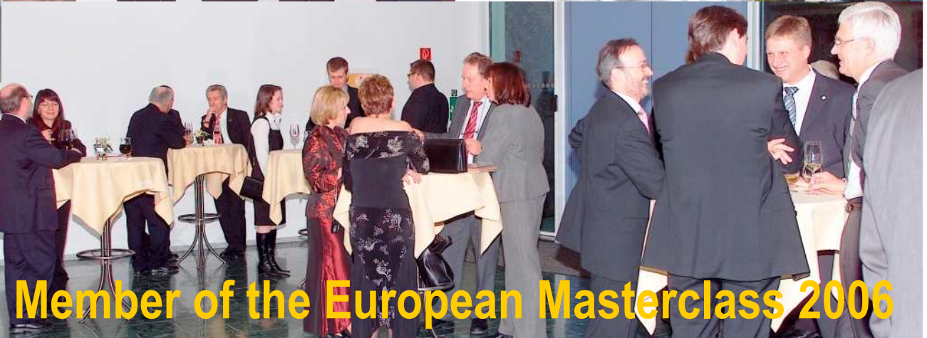
Corporate Media The Member of the European Masterclass 2006